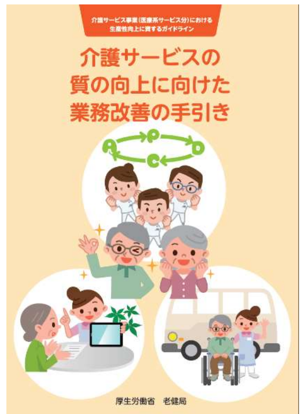
図1 「介護サービスの質の向上に向けた業務改善の手引き」表紙 （出所）厚生労働省ホームページ https://www.mhlw.go.jp/stf/shingi2/0000198094_00013.html

②業務改善の取り組み内容が、「介護サービスの質の向上に向けた業務改善の手引き」に掲載されます。