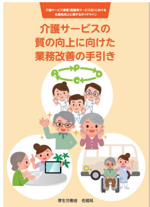
図1 「介護サービスの質の向上に向けた業務改善の手引き」表紙 （出所）厚生労働省ホームページ

https://www.mhlw.go.jp/stf/shingi2/0000198094_00013.html