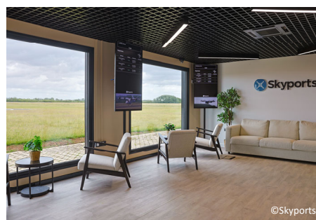
※英国Bicester Motionのターミナル施設