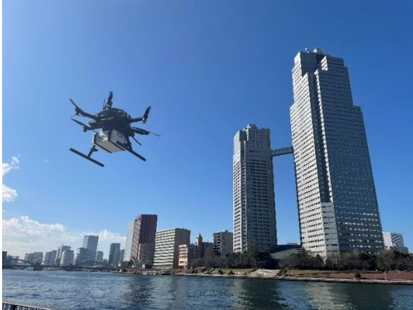
プロジェクトのイメージ (令和3年度のプロジェクトでの飛行の様子)

【プロジェクト実施者】 KDDI株式会社、KDDIスマートドローン株式会社、日本航空株式会社、東日本旅客鉄道株式会社、株式会社ウェザーニューズ、株式会社メディセオ